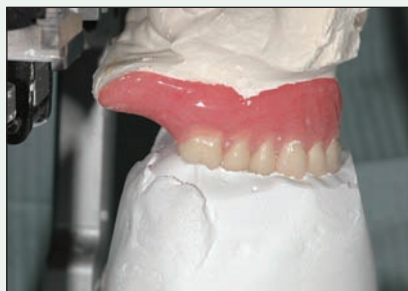
III. 1 : La prothèse supérieure est remontée à l'aide de l'indice de remontage envoyé par le laboratoire.

Ces facteurs devraient être évalués à la première visite et le patient devrait être informé du risque d'inconfort. L'application d'une couche de matériau résilient à l'intrados de la prothèse peut réduire le traumatisme à la muqueuse, qui se trouve comprimée entre l'os sous-jacent à caractère tranchant et la base dure de la prothèse. Si les symptômes persistent après la mise en place du matériau souple, un remodelage des os, une alvéoloplastie ou la mise en place d'implants dentaires pourrait s'avérer nécessaire.