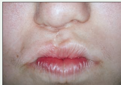
III. 2 : Lèvres en projection avant la chirurgie.