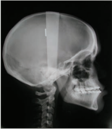
III. 4 : Déficience au maxillaire supérieur.