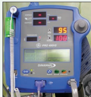
Ill. 1 : Un exemple d'équipement de surveillance approprié pour évaluer le pouls, la saturation en oxygène et la tension artérielle lors de la sédation consciente.

La portée et la nature du traitement requis, l'expérience et la formation du fournisseur de soins et les préférences des parents sont tous des facteurs qui dicteront la stratégie globale de gestion du comportement à adopter, y compris en ce qui a trait à la méthode et à l'agent de sédation. Parmi