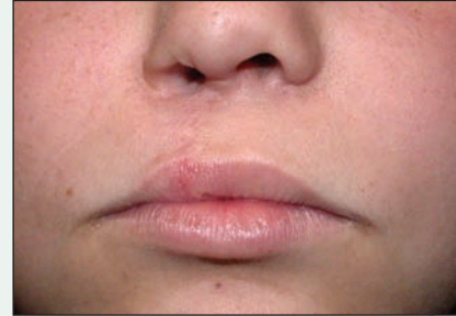
III. 6 : Après l'évaluation fonctionnelle de la lèvre, l'ostéotomie Le Fort I et la greffe osseuse.

pour déterminer si la restauration musculaire qui a été faite durant la chirurgie antérieure est adéquate et précise. Au repos, il s'agit d'évaluer la symétrie et la présence de cicatrice ou de déformation au niveau du vermillon de la lèvre. L'évaluation de la lèvre en projection consiste à évaluer la symétrie et le renflement musculaire. L'examen radiographique consiste d'abord à prendre des radiographies rétroalvéolaires, occlusales (ill. 3) et panoramiques, puis une tomodynamométrie est réalisée s'il y a lieu pour obtenir une meilleure appréciation de l'anatomie de la fente du maxillaire supérieur. L'évaluation du nez vise à déceler toute asymétrie et aplatissement de l'aile du côté de la fente. Enfin, une évaluation clinique, une radiographie céphalométrique latérale (ill. 4) et une analyse céphalométrique sont faites du massif facial pour déceler toute anomalie dentosquelettique. Le déficit antéro-postérieur supérieur et l'absence de soutien labial qui en résulte sont fréquents chez les patients qui ont une fente labiale.