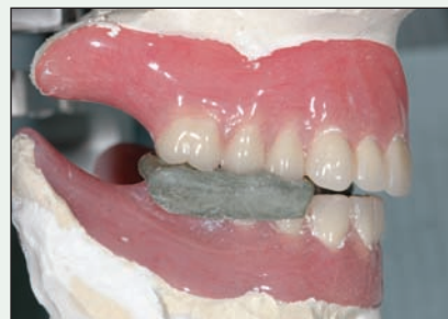
III. 2 : La prothèse inférieure est remontée contre la prothèse supérieure à l'aide du dossier interocclusal obtenu en relation centrée.