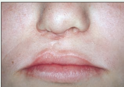
III. 1 : Lèvres au repos avant la chirurgie.

Il est important de faire une évaluation fonctionnelle de la lèvre pour obtenir une esthétique optimale. Cette évaluation doit se faire alors que la lèvre est au repos ( ill. 1 ) et en projection ( ill. 2 ),