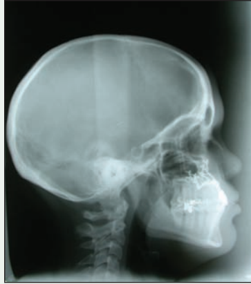
III. 5 : Après l'ostéotomie Le Fort I.