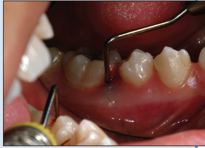
Illustration 2b : Sondage profond localisé avec peu de plaque et de tartre chez le même patient.

des habitudes d'hygiène buccale du patient et un suivi régulier pour éliminer les nouveaux dépôts 21,22 . L'efficacité de ce traitement se traduit par la disparition des symptômes cliniques, la réduction ou l'élimination des parodontopathogènes et le retour d'une flore bactérienne bénéfique. Cependant ce protocole de traitement présente des limites. En effet, tous les patients et tous les sites ne répondent pas uniformément et favorablement à la thérapie mécanique conventionnelle. Cette efficacité réduite de la thérapie peut s'expliquer par un ensemble de facteurs liés au patient (locaux ou généraux), à l'étendue et à la nature de la perte d'attache, aux variations anatomiques locales, à la forme de la maladie parodontale et à la composition du biofilm. La nature infectieuse des maladies parodontales et les résultats limités qui peuvent être obtenus avec des thérapeutiques mécaniques conventionnelles justifient, pour certaines formes de parodontite, l'utilisation d'antibiotiques.