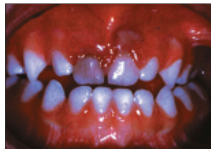
Illustration 1 : Photographie de 2 incisives centrales primaires supérieures présentant une coloration grise à la suite d'un traumatisme dentaire.

La controverse persiste quant au traitement le mieux approprié pour des dents antérieures primaires avec nécrose pulpaire. Certains cliniciens optent pour un traitement de canal de l'incisive primaire au moyen d'une pâte d'obturation résorbable, comme l'oxyde de zinc et l'eugénol non modifié, et d'une couronne temporaire en résine composite. D'autres choisissent