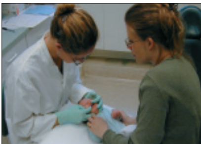
Illustration 1 : Bonne position de l'enfant, du parent et du dentiste, pour l'examen buccodentaire d'un bébé. Le parent tient l'enfant, dont la tête repose sur un oreiller.

1. Goepferd S. Examination of the infant and toddler. In: Pinkham JR, editor. Pediatric dentistry: infancy through adolescence. 2nd ed. Philadelphia: W.B. Saunders Co.; 1994. p. 181-90.