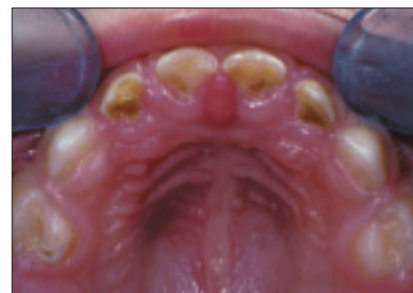
Illustration 1 : Carie de la petite enfance grave chez un enfant de 20 mois, avec atteinte de toutes les faces des incisives supérieures ainsi que des faces occlusales des premières molaires primaires.

les risques de CPE chez l'enfant. La consommation fréquente de tels liquides, sans mesures de prévention adéquates, augmente également le risque. De même, les enfants qui sont allaités au sein sur demande, en l'absence de bonnes pratiques d'hygiène buccodentaire, sont aussi exposés à la CPE 2 .