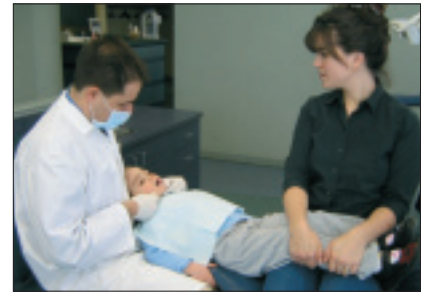
Illustration 5 : Enfant en position couchée. Le dentiste assure une bonne stabilisation de la tête, pendant que le parent assis de côté dans le fauteuil dentaire retient les jambes de l'enfant.