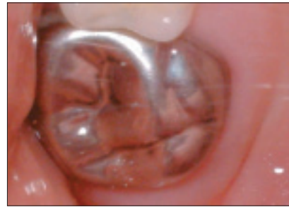
Illustration 1b : La dent a été restaurée adéquatement avec une couronne en acier inoxydable.

premières molaires permanentes n'est que de 36 % 6 . Si l'extraction est envisagée, cette procédure devrait idéalement être pratiquée entre l'âge de 8,5 et 10,5 ans, car une extraction pratiquée au bon moment peut favoriser l'éruption de la deuxième molaire dans l'arcade, en remplacement de la première molaire extraite 3 . La consultation d'un orthodontiste ou d'un dentiste pédiatrique peut être indiquée avant l'extraction d'une première molaire hypoplasique. ➤