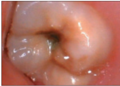
Illustration 1a : Première molaire supérieure permanente droite, avec hypoplasie et hypominéralisation modérées chez un enfant de 6 ans. Des caries occlusales se sont formées. L'anomalie sur la dent 16 s'étend sur le bord gingival des faces buccale et palatine de la dent.