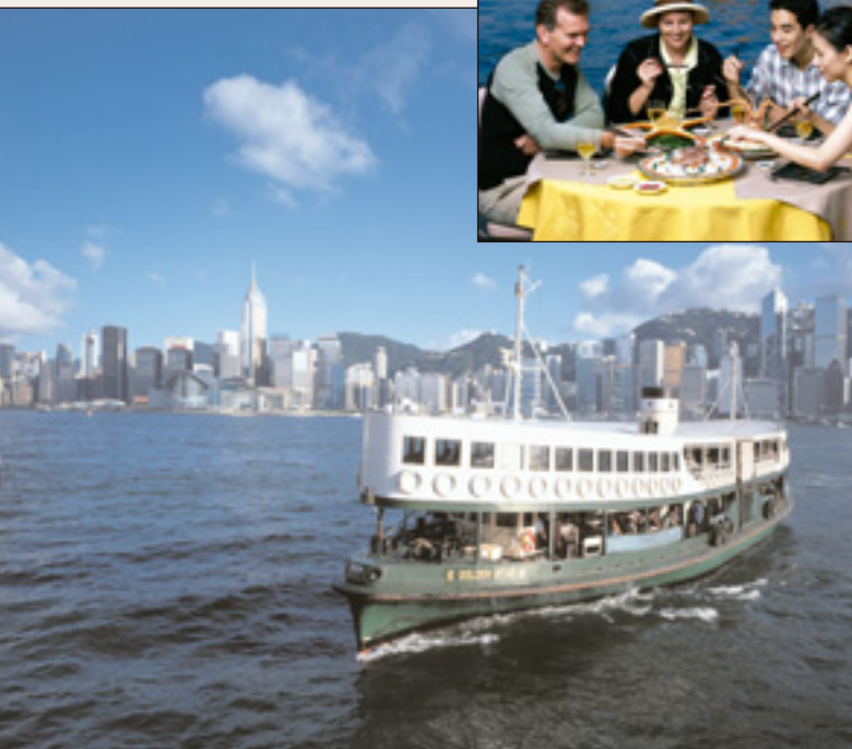
Le Star Ferry traverse le port de Hong Kong.