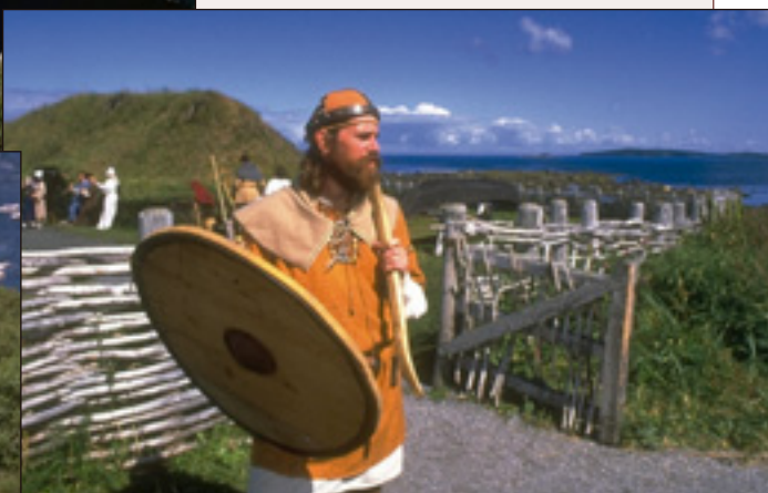
Le site historique de l'Anse-aux-Meadows dans la péninsule Great Northern.