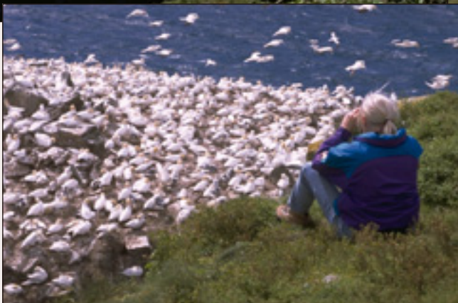
Une «vue d'oiseaux» à la Réserve écologique du cap St. Mary.