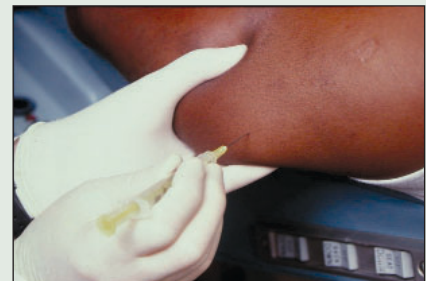
Illustration 4 : Administration d'épinéphrine dans l'épaule.