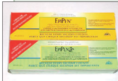
Illustration 1 : Auto-injecteur EpiPen.

L'injection d'épinéphrine par voie IM peut se faire de diverses façons. Le système EpiPen (Dey, Napa Valley, Calif.; ill. 1) et le nouveau système Twinject (Verus Pharmaceuticals, Inc, San Diego, Calif.; ill. 2) sont des auto-injecteurs prédosés, qui contiennent chacun 0,3 mg d'épinéphrine (dose pour adultes). Les auto-injecteurs EpiPen Jr. et Twinject à usage pédiatrique (destinés aux personnes de moins de 30 kg [66 lb]) contiennent 0,15 mg d'épinéphrine. La méthode la moins coûteuse, et aussi la plus polyvalente, consiste à utiliser de l'épinéphrine 1:1000 en ampoules de verre et à l'administrer à l'aide d'une aiguille et d'une seringue. Cependant, quel que soit le système utilisé, il faut toujours se rappeler les 2 points suivants : premièrement, aucun des systèmes n'est à