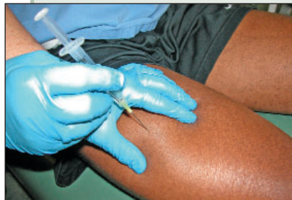
Illustration 3 : Administration d'épinéphrine dans la cuisse.