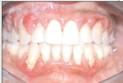
Illustration 1 : Photographie d'un patient souffrant de diabète et de parodontite. Malgré des facteurs locaux manifestes, l'état de ce patient est certainement associé à une aggravation du contrôle glycémique et, par conséquent, à une élévation des taux d'hémoglobine glyquée.

Le cas échéant, vous devriez demander au patient de consulter son médecin pour déterminer si sa glycémie est vraiment bien contrôlée. Un des tests les plus fiables consiste à déterminer le taux d'hémoglobine glyquée (hémoglobine A1c). L'hémoglobine glyquée (ill. 2) est une protéine formée par la réaction entre les chaînes latérales des acides aminés et les molécules de glucose, en particulier lorsque le taux sérique de glucose est élevé. L'hémoglobine glyquée a une longue demi-vie dans le sérum. Chez un patient «à la limite» du diabète, une glycémie aléatoire pourrait être normale. Cependant, si le patient a des pics relativement brefs d'hyperglycémie, la formation d'hémoglobine A1c augmentera et cette hémoglobine restera dans le sang pendant plusieurs semaines. La mesure de l'hémoglobine A1c donne donc une évaluation plus exacte du contrôle de la glycémie du patient, qu'une glycémie mesurée de façon aléatoire. Vous ou votre patient pouvez demander au médecin que ce test soit effectué.