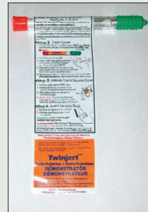
Illustration 2 : Auto-injecteur Twinject.